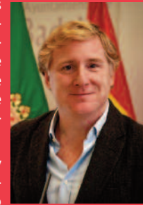
Ignacio Gragera Alcalde de Badajoz

Badajoz está preparada. Con permiso de Ad Libitum: Aquí nuestro Carnaval... señores.